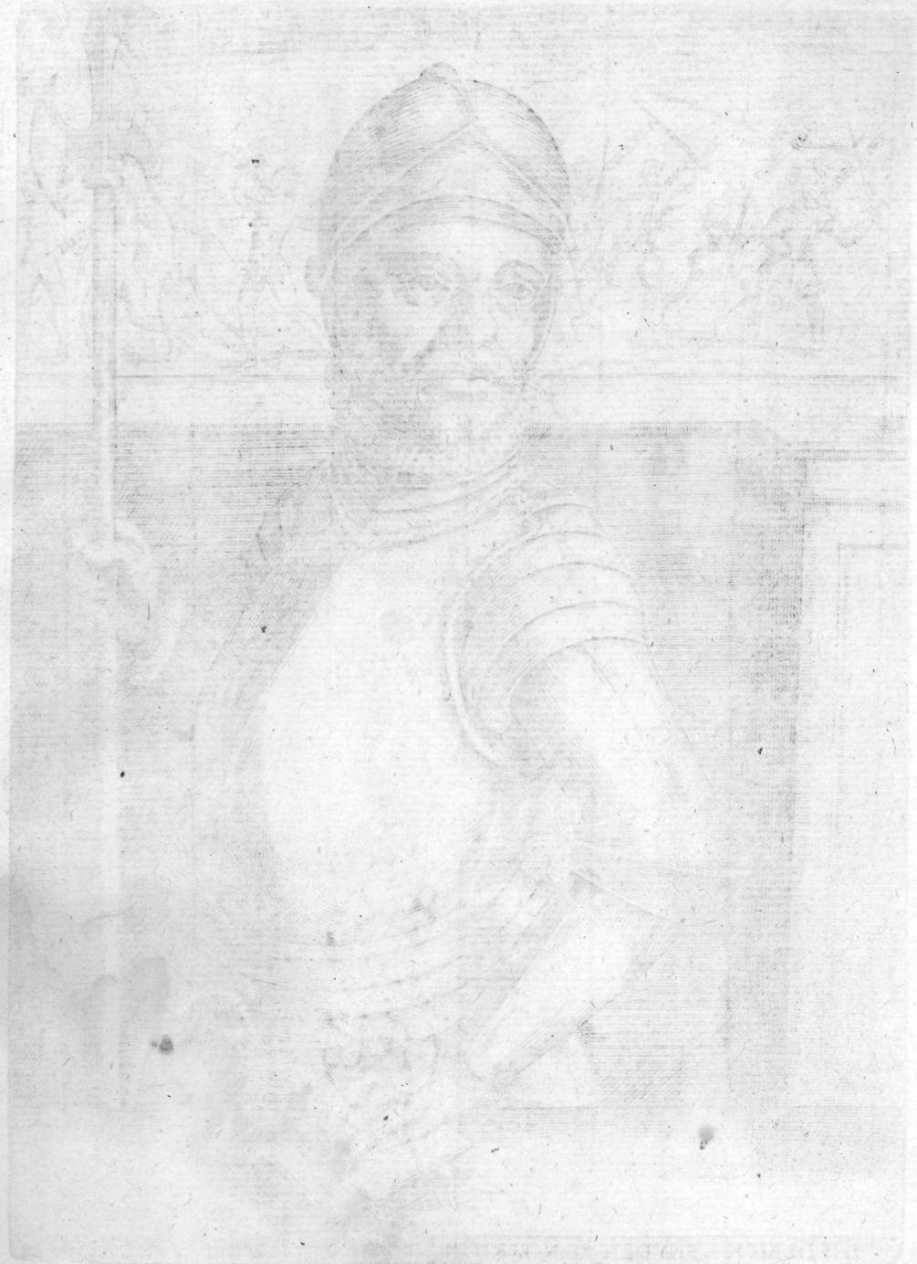
THEODORUS SARTOR INDIVAGUS.