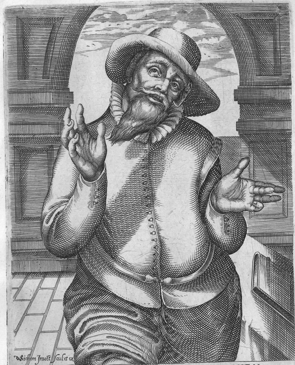
ADAM PASTOR VAN DORPHEN.