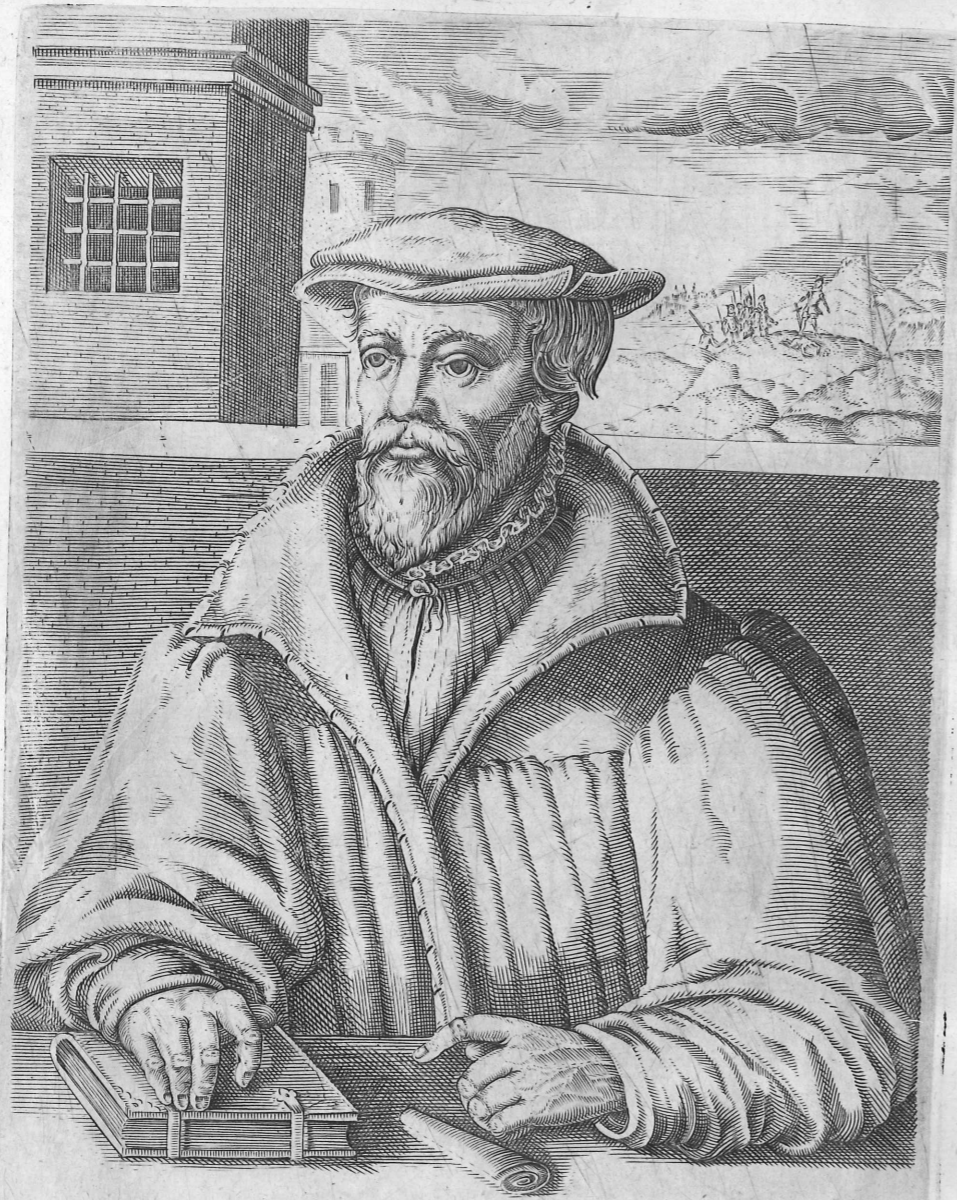
LODOWYCK HETZER PREDICER AVERDE 1529 TOT COSTANTZ ONTHOOF T