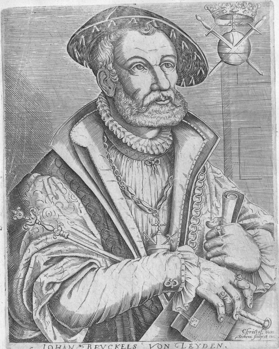
JOHAN BEUCKELS VON LEYDEN. IOHANNES BEUCKELS