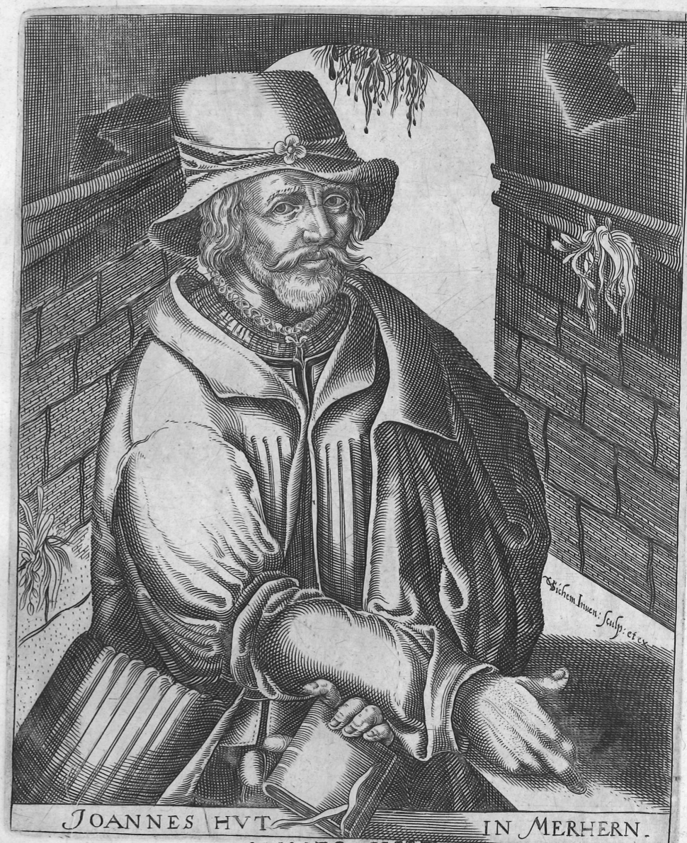
JOANNES HUT IN MERHERN.